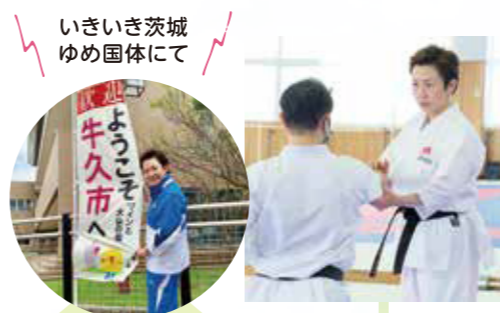
いきいき茨城ゆめ国体にて

中高生世代が将来的にも県内で競技活動が継続できるよう、その受け皿となる県内クラブやチームへの支援も継続強化し、ジュニアから成年まで一貫した競技力向上につなげていく。