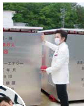
高山市の水素ステーションを視察(5月)。

このため、次期エネルギービジョンの策定に向けては、こうした動きをさらに加速化させるため、例えば公用車への更なる導入拡大、各圏域2か所の水素ステーションの増設、あるいは車両価格の引き下げに向けた国の購入支援の拡充を要請することなども含め、広く関係の皆様と議論を進めていく。